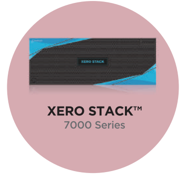
XERO STACK™ 7000 Series