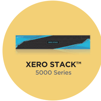
XERO STACK™ 5000 Series