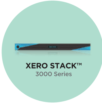
XERO STACK™ 3000 Series